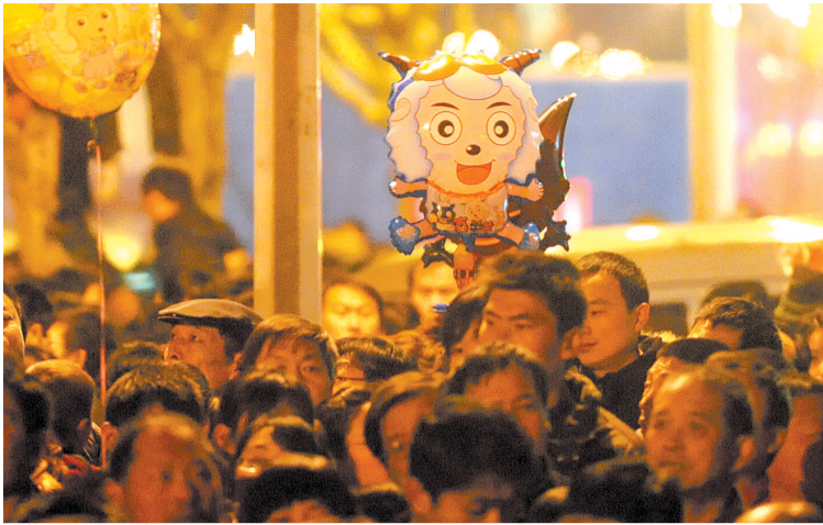
晚报记者 王银廷 实习生 张郁 图