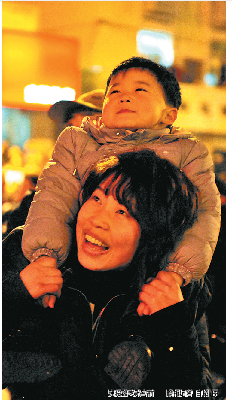
建设路与桐柏路附近