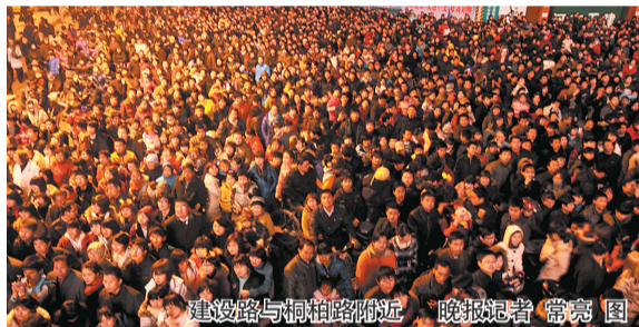
建设路与桐柏路附近