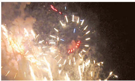
烟花也欢颜