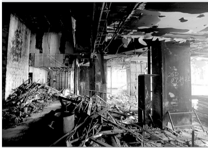
楼体内部损毁严重

记者昨日获悉,北京市第二中级人民法院已受理央视新址大火案,这起危险物品肇事案的涉案人数为21人,法院已开始对所有被告人和辩护律师送达起诉书。该案预计在本月底开庭。2009年2月9日,在建的央视新台址园区,因单位违法燃放烟花,发生特别重大火灾事故。近日,记者进入这座大楼,亲眼目睹大楼过火后的千疮百孔。