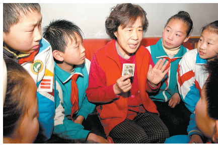
伏牛路四小的小学生们来到刘奶奶家,听她讲述当年学雷锋的故事。