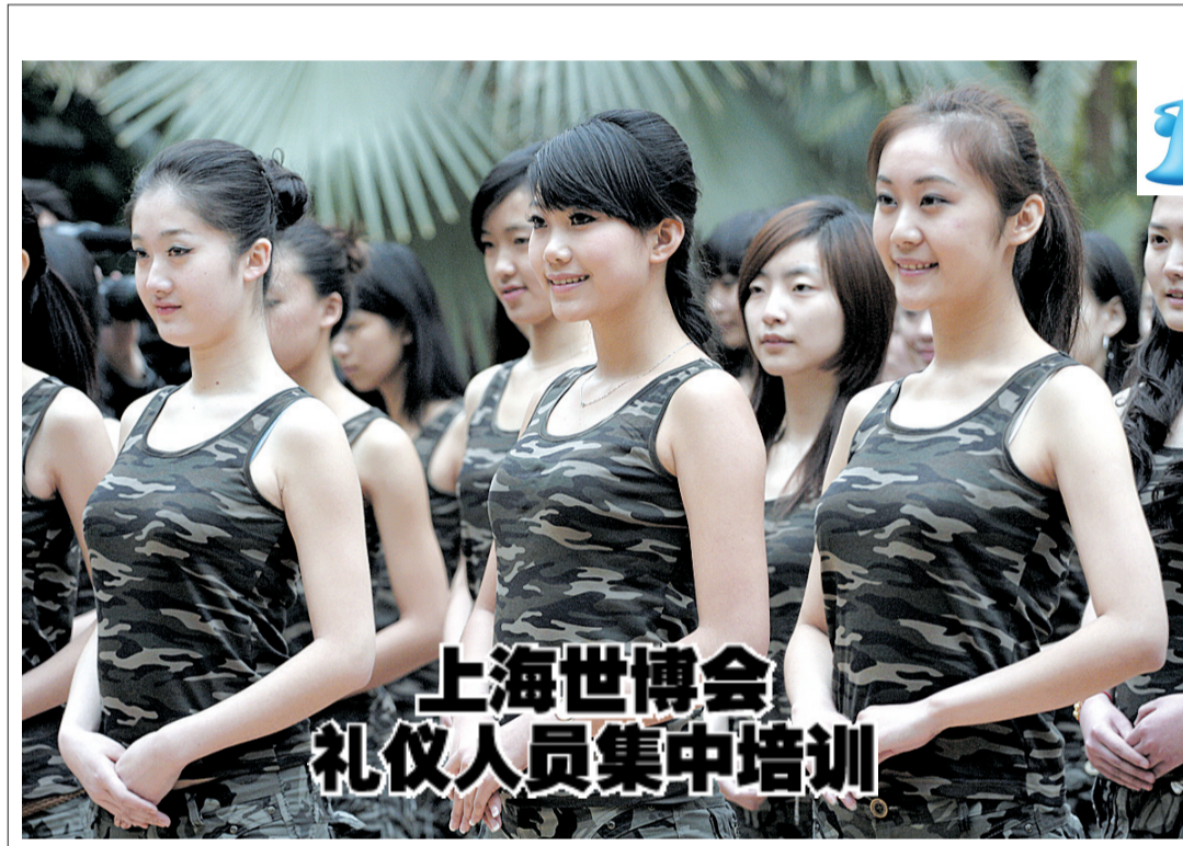
上海世博会礼仪人员集中培训

7日,杭州贝因美集团宣布的一条消息,在国内企业中引来热议。该集团称,自今年三八妇女节起,将率先在全国推出女职工18个月哺乳假制度,并号召其他企业“跟进”,以保证母婴身心健康。可是,贝因美的操作方式,在推广起来或有困难。部分企业表示,用工成本太高,是无法给出“长假”的重要因素;也有一些女性表示,自己需要工作,而非超长产假。据《青年时报》