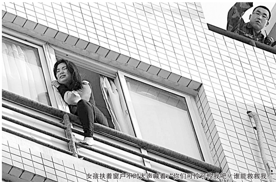
女孩扶着窗户不时大声喊着:“你们可怜可怜我吧!谁能救救我。”

昨日8时20分,在工人路与宏河路交叉口东侧的金淮小区,在临街的小高层最顶层,一女孩骑着窗户左腿悬在空中,扶着窗户不时大声喊着:“你们可怜可怜我吧!谁能救救我。”二七消防大队二中队10多名消防队员把高压气垫放置在正对女孩的楼下。