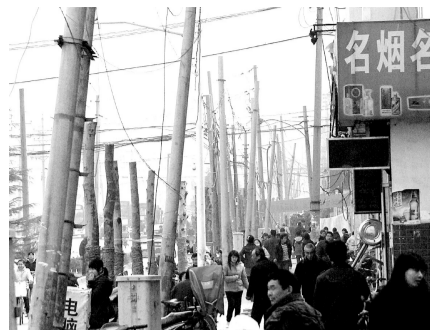
郑上路东倒西歪的线杆