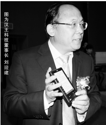
图为汉王科技董事长刘迎建

直颇受关注。业界认为此次成功上市将有利于汉王向规模化、多元化发展,同时也利于加快汉王科技的在数字阅读领域拓展的速度。在目前已发布的券商研究报告中对汉王科技好评如潮,由此可以窥见投资者对于公司成长前景的高度看好。