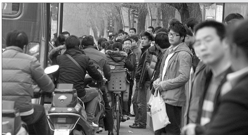
昨日下午,在花园路上一公交站牌边挤满了众多等公交车的市民。