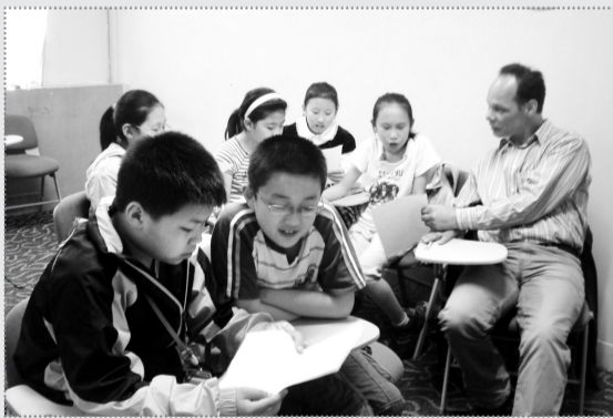
孩子们正在与外教交流。