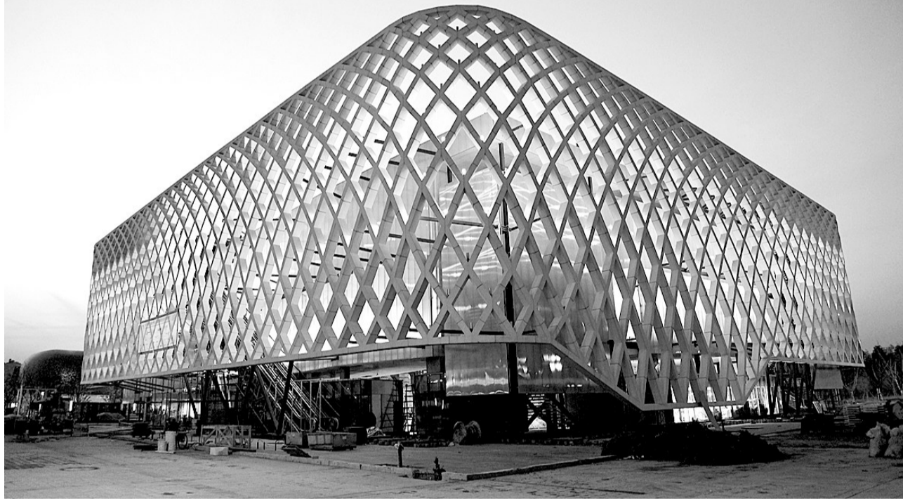
3月16日拍摄的进行试灯的法国馆。

近期,工作人员正对上海世博会各场馆和园区设施进行试运营前的调试和施工。从4月20日起,上海世博园区将进行5场试运营。届时,中国馆、丰碑馆、文化中心、世博中心等由世博会组织者负责的场馆将开门迎客,一部分国外展馆可能也会加入试运营。