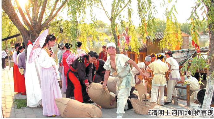
《清明上河图》虹桥再现

“我们的节日——中国(开封)2010清明文化节”将于3月26日至4月11日在开封举行。据悉,本次清明文化节期间将举办大巡游等广场文化系列活动,民俗民风展演、大型水上实景演出《清明上河图》以及祭拜焦裕禄、刘少奇等缅怀先烈活动,活动规格之高、会期之长,为历年之最。 刘书芝