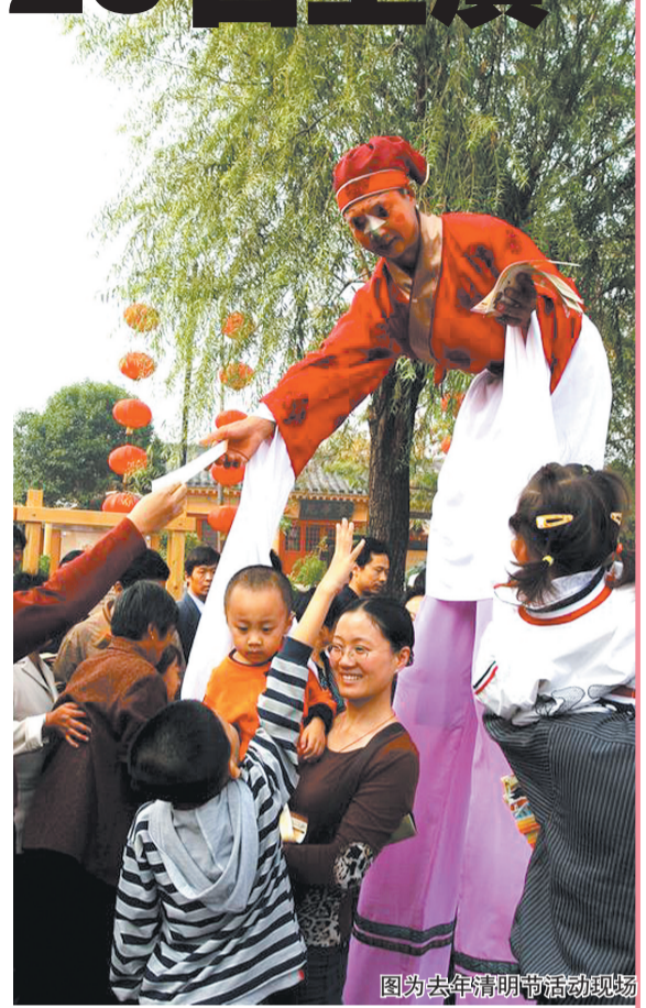
图为去年清明节活动现场

届时,在清明上河园,白天游客能看到一个真实的“东京”,晚上看到的就是一个充满艺术气质的“东京梦”、永不落幕的“清明上河夜”。