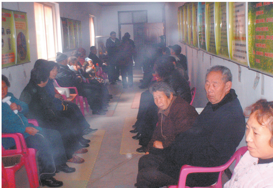
在村文化大院老年活动室，不少乡亲在这儿做保健