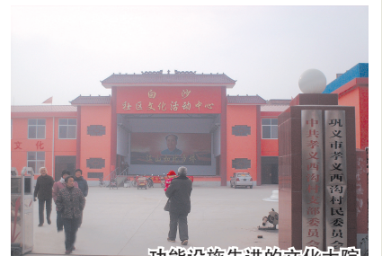
功能设施先进的文化大院