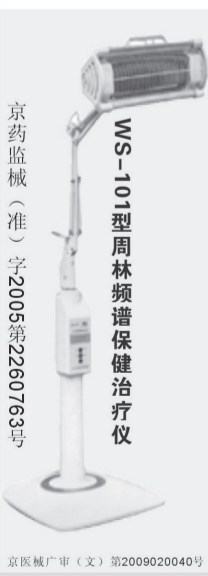
京药监械(准)字2005第2260763号