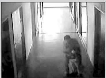
一次,吴小姐被董事长拖进办公室,被单位的摄像头录了下来。