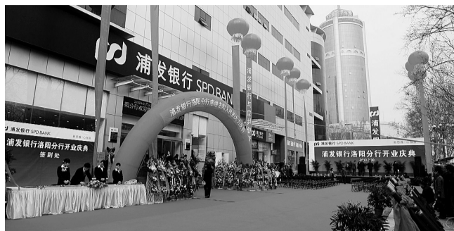
昨日上午,在雄壮的音乐声中,浦发银行洛阳分行正式宣布开业。这也是浦发银行郑州分行在河南地区设立的第二家异地支行,填

补浦发银行在豫西机构空白,进一步提升业务辐射能力,实现又好又快发展的重要举措。也是郑州分行立足中原城市群,形成十字型互动网点布局的关键一步,它的成立必将加快洛阳地区经济发展。