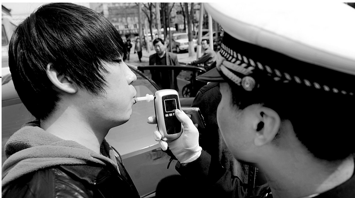
一名司机在接受酒精测试。