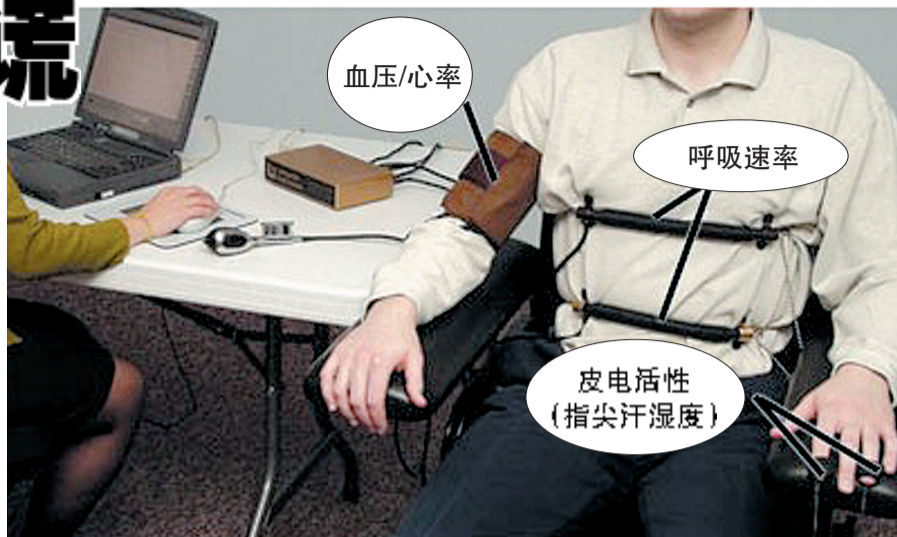
用来监测生理反应的测谎仪部件(示意图)