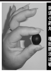
就这小药丸 埋肚脐治过敏

敏特中药丸埋脐直接针对五脏六腑给药,不再经过肝肾就能调节体液平衡,一次拔除体内寒、湿、毒素,净化血液,改变细胞变态反应,从根本上治愈过敏性疾病。一丸起效,15丸让你告别过敏,即使你再遇到过敏源,也不会再发作。