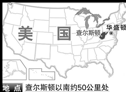
地点 查尔斯顿以南约50公里处