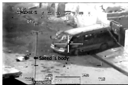
美军直升机向记者坐的面包车开火

两年前的这起事件发生后,驻伊美军向美联社提供了一些有关路透社记者遇难事件的调查材料,当时的调查结论是,美军行为恰当,路透社记者可能“与武装人员混在一起”,其随身