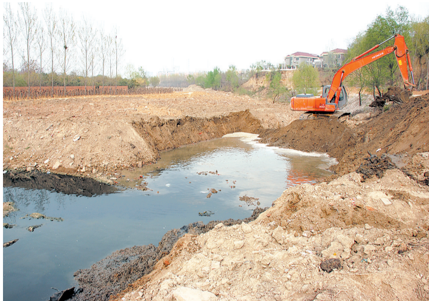
昨日,一辆挖掘机在清理河道。

程还需要试水,通水大概要等到5月底之前,“现在水非常少,放一湖水大概需要20万立方米”。记者昨天注意到,引黄河水入栉园水厂时在湖底修的石头路仍然没有清理,西流湖管理处希望相关施工单位及时将湖底道路予以清理。