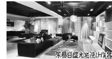
东易日盛大宅设计作品