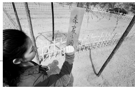
▲瞧,我认养的小菜园。 ◀现实版开心农场看上去很别致。

马先生沿着自家露台的边沿砌出一块菜地,冬天的时候埋大葱,春天就开始种菜,“中午去拔一把蒜苗,炒个蒜苗鸡蛋,感觉特别香,这才是真正的无公害呢”。同时,马先生感觉自己种菜还有一个好处,那就是3岁的女儿爱上吃菜了,“让她参与播种、浇水,特别兴奋,开始只是参与,后来就完全自己操作。再吃菜的时候特自豪,说这是我种的。”