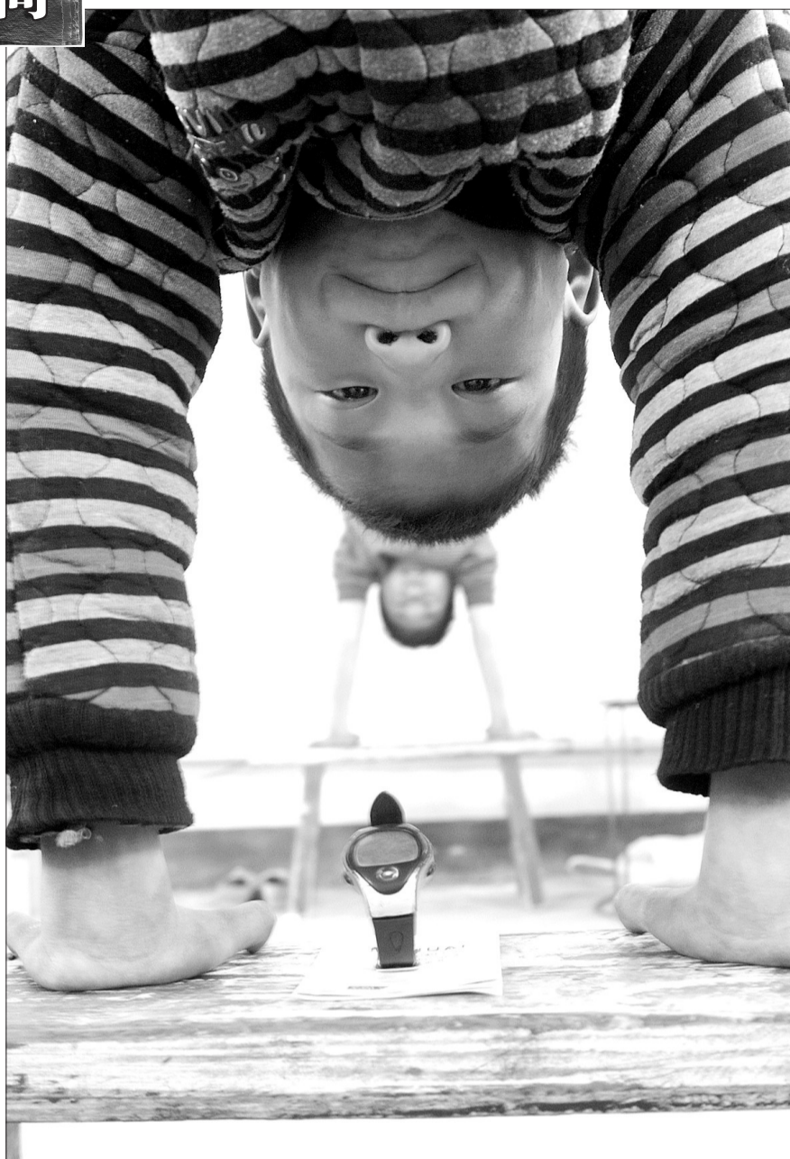
▲倒立是最基本也是最难熬的训练,每个孩子的面前都放着一块表。在孩子的眼里,此刻的时间是最慢的。