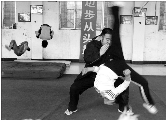
▲练习空中翻腾动作时,老师会用双手在演员腰间帮助用力并给予保护。