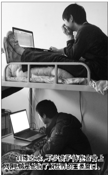
训练之余,不少孩子待在宿舍上网,电脑是他们了解世界的重要窗口。

杂技为祖辈生活在农村的孩子们提供了一条“出人头地”的路子,这群绝大部分来自农村学员的父母,抱着同样的渴望将子女送进杂技团。辛勤的汗水没有白流,目前杂技团的演员们不仅在国内演出,而且大部分节目都走出了国门,在世界各地表演。很多杂技团的演员们常年在欧美地区演出,不仅走出了“出人头地”的路子,走向了世界,而且也让世界了解了他们,了解了中国文化。