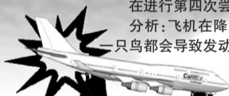
飞机在距机场跑道300米至400米处撞上树木

在进行第四次尝试的时候,飞机撞上一片树林,随即断裂坠毁。分析:飞机在降落过程中处于低飞状态,此时撞到任何障碍物,即便是一只鸟都会导致发动机涡轮损坏而坠毁,更不用说是森林这么大的障碍物。