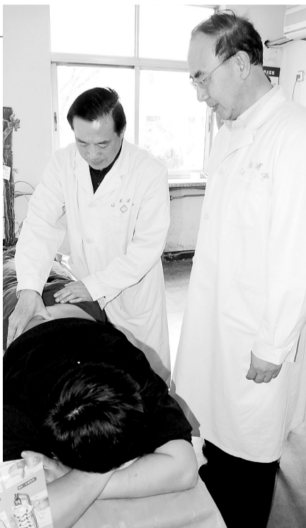
▲专家在给患者做检查