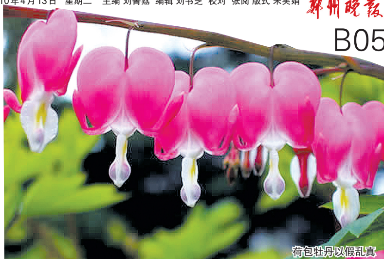
荷包牡丹以假乱真

到时有4个地方可看:西流湖牡丹园、黄河游览区牡丹园、碧沙岗公园牡丹园和尖岗水库牡丹园。记者打探得知,因为受气温的影响,郑州的牡丹要盛开,最少也得等一周后。上周四记者前去黄河游览区采访,牡丹园还大门紧闭,园区工作人员介绍,