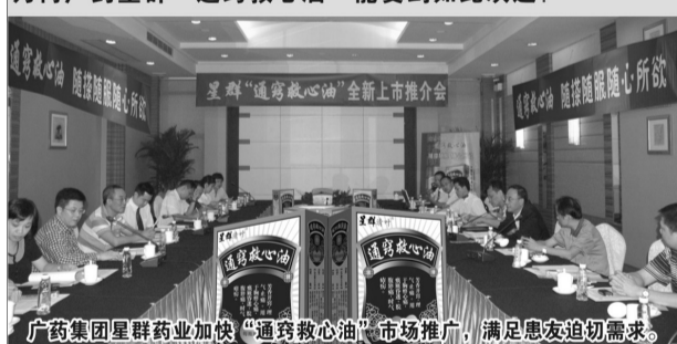
广药集团星群药业加快“通窍救心油”市场推广，满足患友迫切需求。

此次评选历经3月余且以全国消费者投票作重要依据，为何广药星群“通窍救心油”能受到如此欢迎？