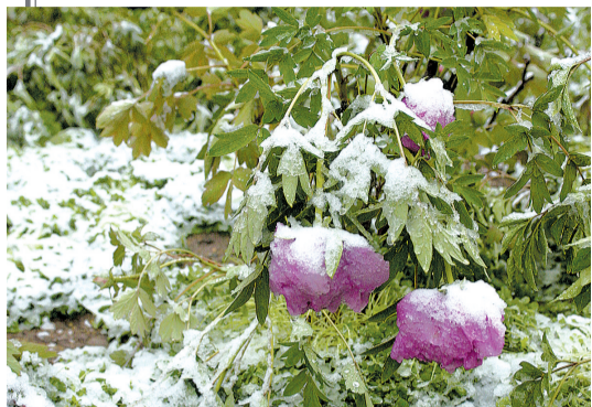
洛阳街头,大雪压弯了怒放的牡丹。