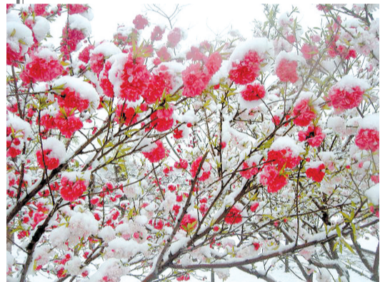
嵩山,桃花在白雪的映衬下,娇艳欲滴。