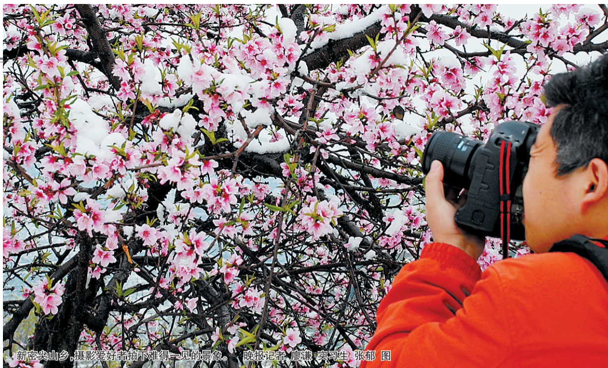
新密尖山乡,摄影爱好者拍下难得一见的景象。