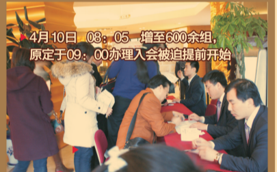
▶ 4月10日 08:05 增至600余组, 原定于09:00办理入会被迫提前开始