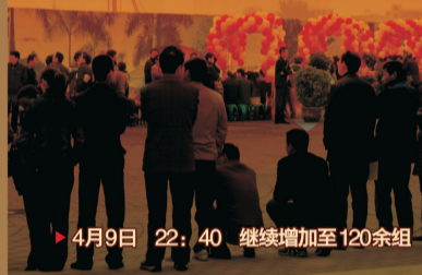
▶ 4月9日 22:40 继续增加至120余组