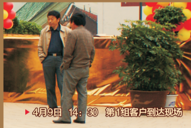
▶ 4月9日 14:30 第1组客户到达现场