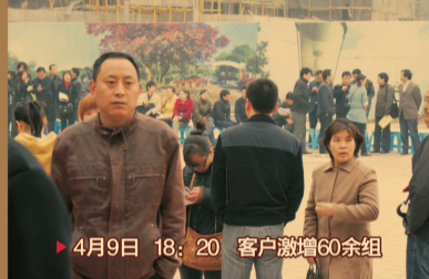
▶ 4月9日 18:20 客户激增60余组