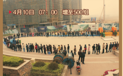
▶ 4月10日 07:00 增至500组