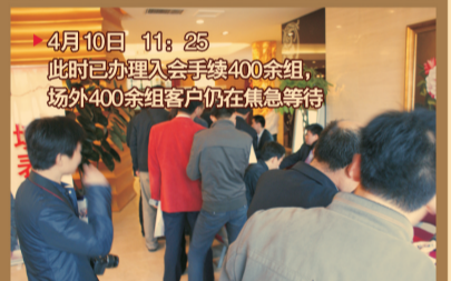
▶ 4月10日 11:25 此时已办理入会手续400余组, 场外400余组客户仍在焦急等待