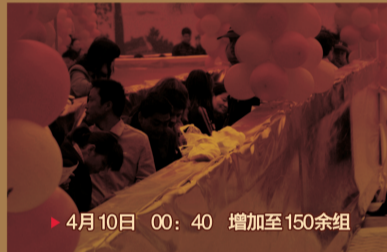
▶ 4月10日 00:40 增加至150余组