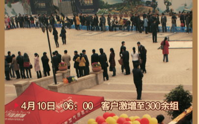
▶ 4月10日 06:00 客户激增至300余组