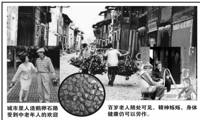
城市里人造鹅卵石路受到中老年人的欢迎

结合韩国的能量石养生、日本的永磁红外线养生两大理论开发的“百步康”走毯，具有多达648个能量凸点，具有疏通血脉、提升气血、调节脏腑的功能。