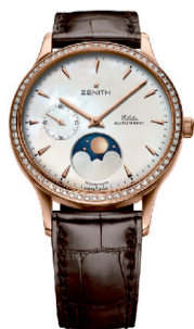
RMB: 125,000( 玫瑰金款)

时尚之至的不锈钢或玫瑰金材质,纯色的珍珠贝母表盘搭配镶钻表壳,精巧的33毫米表盘直径。这款腕表还有一个特点:月相可以直接通过小表冠作出调整,从而保证了各部分设计的平衡。白色鳄鱼表带配不锈钢表壳或者棕色鳄鱼皮搭配玫瑰金表壳,都非常适合女士纤细手腕的自戴。