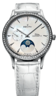
RMB: 68,000( 不锈钢款)