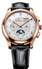
RMB: 128,000( 玫瑰金款)