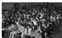
四川大学讲座现场