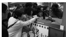
湖南讲座报名现场

讲座内容：1、志愿填报的终极目标 2、河南2010年志愿填报新规则分析；3、志愿填报实用技巧 4、志愿填报潜规则；5、冲刺阶段家长应该做好哪些工作？