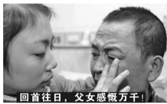
回首往日,父女感慨万千!