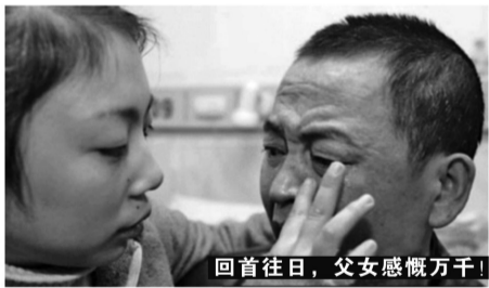
回首往日,父女感慨万千!