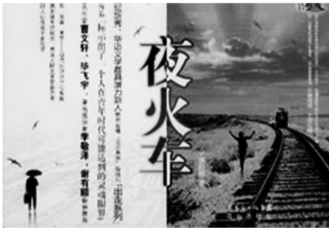
■书名:《夜火车》 ■作者:徐则臣 ■花城出版社