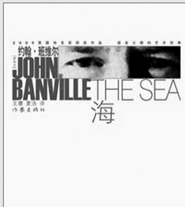
■书名:《海》 ■作者:约翰·班维尔 ■作家出版社