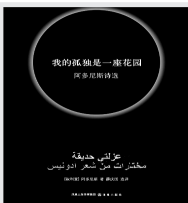
■书名:《我的孤独是一座花园》 ■作者:阿多尼斯(叙利亚) ■译林出版社

其实关于纳粹的作品并不少,《辛德勒名单》《钢琴家》都是,但这些作品与《朗读者》相比,都属正面进攻。而《朗读者》是不折不扣的另辟蹊径。故事从姐弟恋开始:一个少年爱上了一个女公共汽车售票员,这个女人叫汉娜,是个成年人。两人邂逅时,这个少年还是个孩子。两人相爱了一段时间。这段时间里,汉娜经常让这个男孩子给自己朗读作品。后来他知道,她是个文盲。有一天,汉娜失踪了,少年上了大学,学的是法律,有一天,在法庭上,他碰见了汉娜,汉娜正在接受审判——她是集中营的女看守,是战犯。此时,这个少年发现自己还爱着汉娜。而汉娜因为是文盲的关系,在这场战争中其实也是个懵懂的受害者。——这个时候,所有的问题都来了。道德的问题,伦理的问题,良知的问题,责任的问题……纳粹分子也是人,而且也是个受害者!这个小说的角度让我们体会到了更繁复的主题,让我们体会到了更大的悲悯。也正因此,这个小说让自己与这个领域的所有作品都区别开来,成为世界文学里一种独特的心灵发现。 (请继续阅读C03版)