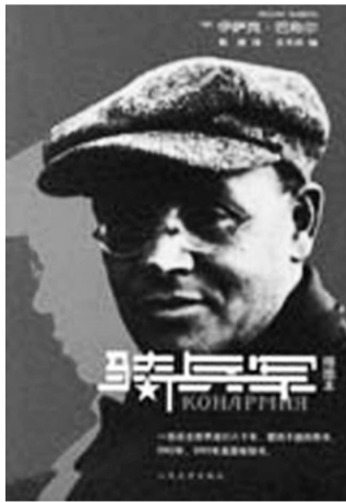
■书名:《骑兵军》 ■作者:伊萨克·巴别尔(前苏联) ■人民文学出版社