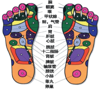
足底反射区示意图

淘汰了，之所以流传到现在还在发扬光大，就是因为有效果，有些疾病连西医也束手无策了，只好回来又选择中医穴位治疗。所以为了让自己更健康，也为了家里老人摆脱疾病困扰，买上一个康祝梅花桩能量走毯，全家都健康，还节省了很多医药费，谁能不喜欢呢？