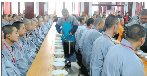
400多名沙弥一起用斋,他们要在少林寺进行为期28天的受戒。