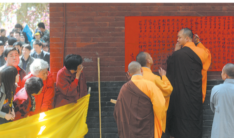
一位“引礼”在墙面上书写所有“引礼”的名单。