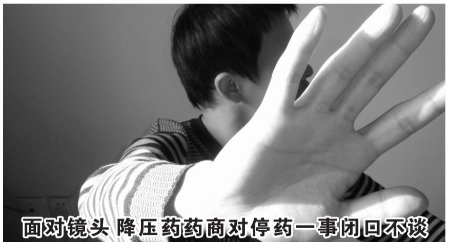
面对镜头 降压药药商对停药一事闭口不谈

治病，非常适合高血压、心脏病、脑血管病。 90年代，韩国发生“烤肉门”事件，爱吃烤肉的韩国人，高血脂高血压心脏病猝死人数急剧上升。于是政府牵头，决心在餐桌上治病，把吸脂膳物质和多种珍贵药膳食品以统一标准配置配成一粒软胶囊早餐，并且规定：高谷压心脏病脑血管病人必须餐疗。