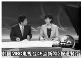
韩国MBC电视台《5点新闻》报道餐疗