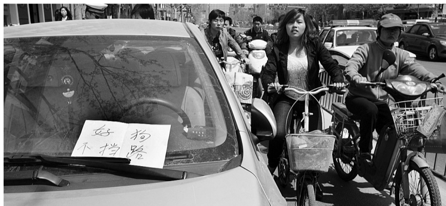
昨天上午,一辆轿车被人贴上了“好狗不挡路”的“罚单”。在花园路与黄河路向北 10 米路西,豫