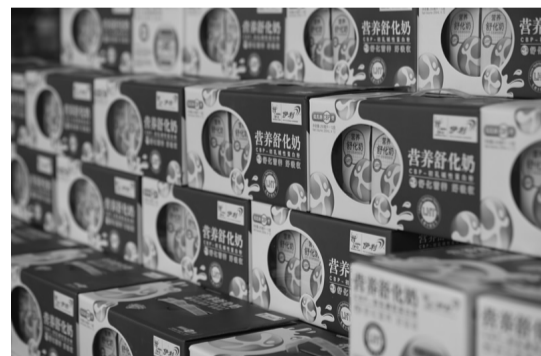
海世博会 7000 万中外来宾提供乳制品服务的世博牛奶必将于 2010 年再领乳业风骚!

乳品消费专家指出,在资讯日趋发达的今天,消费者已经不仅仅依靠广告效应来决定消费哪种牛奶,更开始注重产品的内涵和品牌价值,随着世博会热度的升高,伊利牛奶的世博效应也会进一步显现,为上