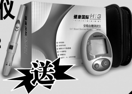
本血糖仪为健康国际公益赠品（内含精致皮包，采血笔）