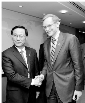
中国财政部长谢旭人(左)会见世界银行行长佐利克。

世界银行发展委员会春季会议25日通过了发达国家向发展中国家转移投票权的改革方案,这次改革使中国在世行的投票权从目前的2.77%提高到4.42%,成为世界银行第三大股东国,仅次于美国和日本。