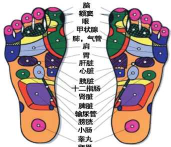
足底反射区示意图

淘汰了，之所以流传到现在还在发扬光大，就是因为有效果，有些疾病连西医也束手无策了，只好回来又选择中医穴位治疗。所以为了让自己更健康，也为了家里老人摆脱疾病困扰，买上一个康祝梅花桩能量走毯，全家都健康，还节省了很多医药费，谁能不喜欢呢？