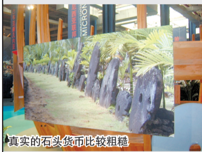
真实的石头货币比较粗糙

在太平洋联合馆内闲逛,突然被形如石磨盘一样的石头吸引住。“磨盘”呈圆形,中间有孔,很像中国古代的铜钱。