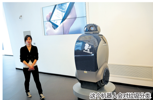
这个机器人会对垃圾分类

精致的意大利人并不缺乏浪漫,走进意大利馆,可以看到房顶上倒长着麦子和鲜花,五颜六色的椅子和钢琴被安置在墙上,穿着晚礼服的塑胶模特也在一处庭院的墙上排好了队列。