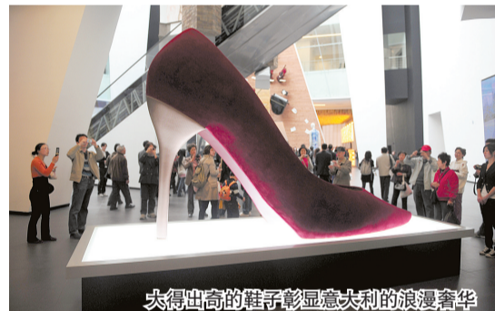
大得出奇的鞋子彰显意大利的浪漫奢华

大得出奇的鞋子和橱柜里摆放的一排排香槟美酒,再加上温柔朦胧的灯光,让浪漫、奢华的情绪浓郁到了极致。