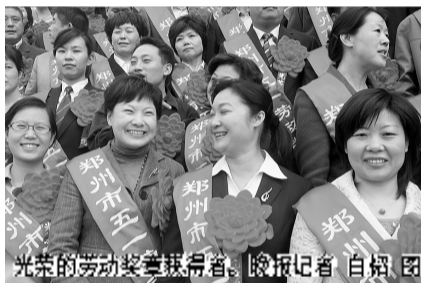
光荣的劳动奖章获得者。

据悉，4月27日，全国劳模表彰大会上，我市有16名劳动模范和先进工作者受到了表彰。