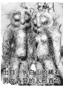
出自于长白山的稀有鸟

该地区的中美合资天诚药业就是依据该秘方深度开发，研制出“六君生发胶囊”独方国药，在原方基础上结合了两味新药，利用现代领先制药酶技术，能大量提取多种有效活性成分，解决脱发生发两大难题：1 脏腑气血的调理问题；2 萎缩的毛囊激活问题。该药从根源上入手通过调理肝肾，调和气血和内分泌增加血液的有效灌注。另一方面直接补充头发生发所需的蛋白质、维生素、微量元素