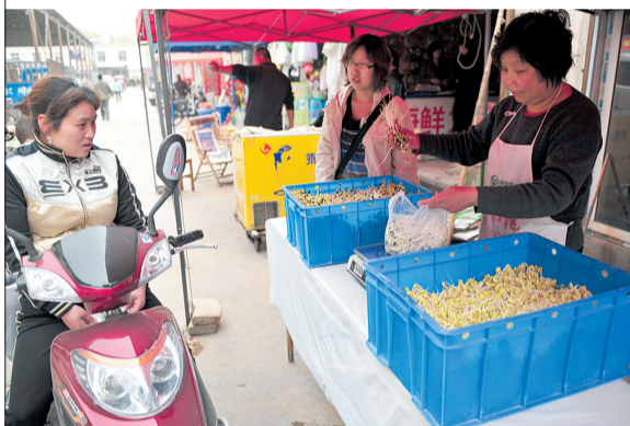
冉屯路上的朱屯农贸市场,卖豆芽的姜大姐说,绿豆太贵,已经好几天没生绿豆芽了。