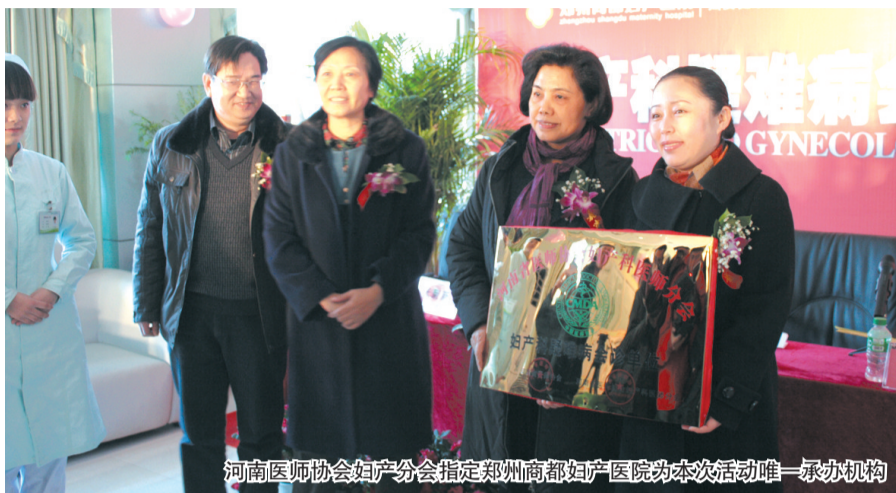
河南医师协会妇产分会指定郑州商都妇产医院为本次活动唯一承办机构