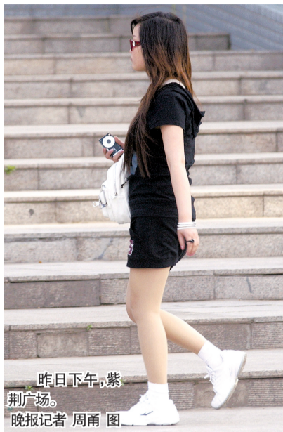
昨日下午,紫荆广场。

昨夜到今天,晴天间多云,东南风2到3级,最高温度24℃到25℃。 5月1日,晴天间多云,西南风3到4级。最高气温29℃到30℃。 5月2日,晴天到多云,偏南风4级转2到3级。最高气温32℃到33℃。 5月3日,多云,下午到夜里多云间阴天。东南风2到3级。最高气温30℃到31℃。