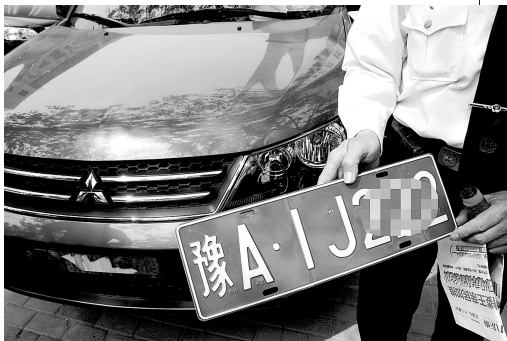
巡防队员从路边的草丛里发现了这个车牌。

●停车场东南角的树上有一个摄像头。不过这个摄像头被新长的树叶给挡了个严实,基本成了摆设。