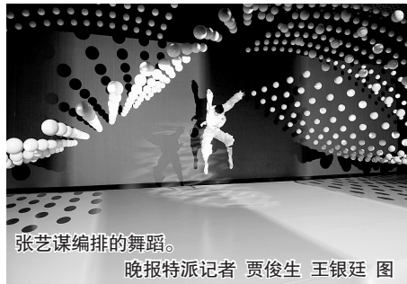
张艺谋编排的舞蹈。 晚报特派记者 贾俊生 王银廷 图

在民营企业联合馆中，如何表现民营企业的活力，富有创意的奥运会开幕式和《印象西湖》导演团队耗资1亿元，用1008个球为游客呈现了一场视觉和听觉大餐“活力矩阵”高潮秀。在8分钟的表演中，1008个浮球组成的矩阵在音乐起伏中不断变化结构、画面和运动轨迹，配合真人的太极表演，演绎四季，歌颂生命，将高科技与艺术表演融为一体。世博会开幕后，民企馆高潮秀计划每天上演30~55场，每场可同时容纳300人观看。 晚报特派记者 张锡磊