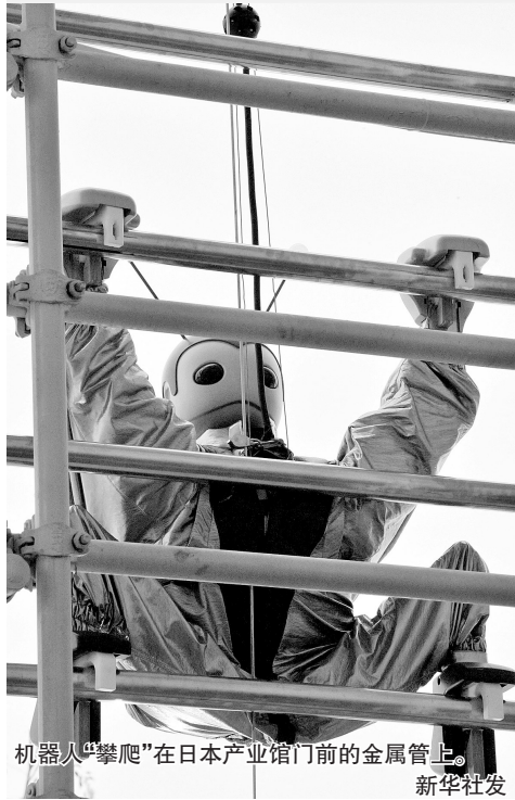
机器人“攀爬”在日本产业馆门前的金属管上。