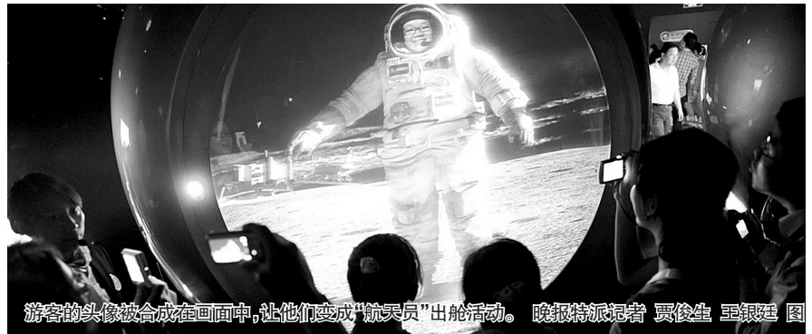
游客的头像被合成在画面中，让他们变成“航天员”出舱活动。

在太空中行走有什么感觉？太空中都有着怎样的景色？在太空中如何生活？走进位于世博浦西园区的太空家园馆，你将会得到答案。太空家园馆远远看去，就像一个纸盒。乘电梯而上，就进入了“太空家园馆”的第一站梦想起源区。来到这里，仿佛置身于神奇的浩瀚太空，头顶上的蓝色苍穹触手可及，不远处的太阳、月亮、星星鳞次栉比，各种各样的飞行器在身边穿行。在太空家园馆，最受游客欢迎的是航天