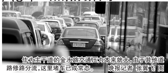
作为主干道的金水路交通压力本来就大,由于其他道路修路分流,这里堵车已成常态。