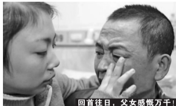
回首往日,父女感慨万千!

务了一辈子农活的老郑40年前患上牛皮癣,从脖子到腰布满了厚厚的鳞屑,痒起来总是抓得全身血迹斑